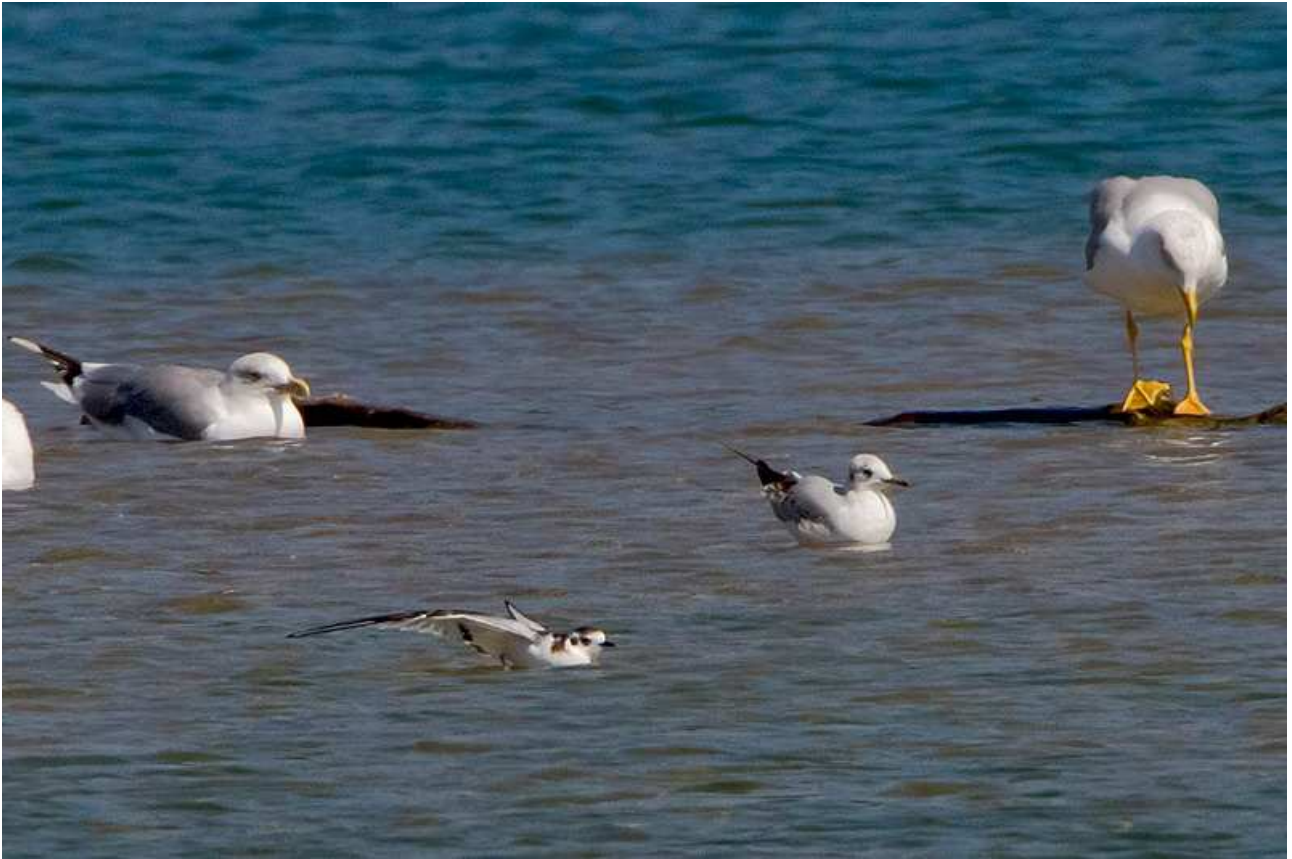
Die Zwergmöwe ist für die meisten Teilnehmenden eine Erstbeobachtung. Umgeben von Lach- und Mittelmeermöwen perfekt für einen Grössenvergleich.