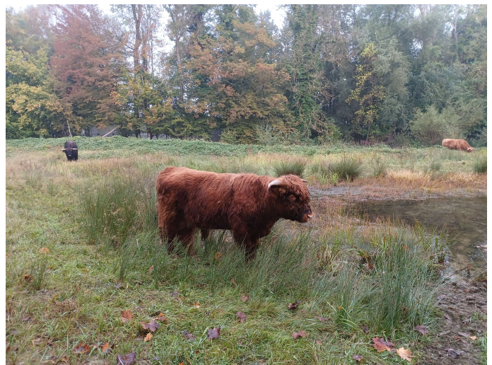
... und wir aus der Nähe: Schottische Hochlandrinder