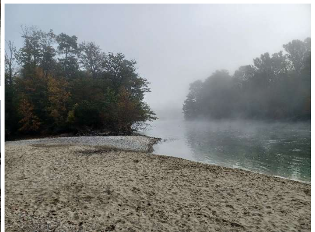
Am Brugger Sandstrand