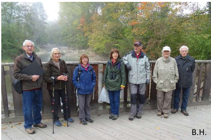
Nistkastenteam 2 (ohne den Fotografen)

Den Helfenden sowie den Teilnehmenden gebührt ein herzliches Dankeschön.