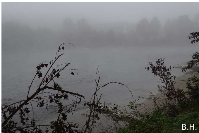
Nebelstimmung an der Aare