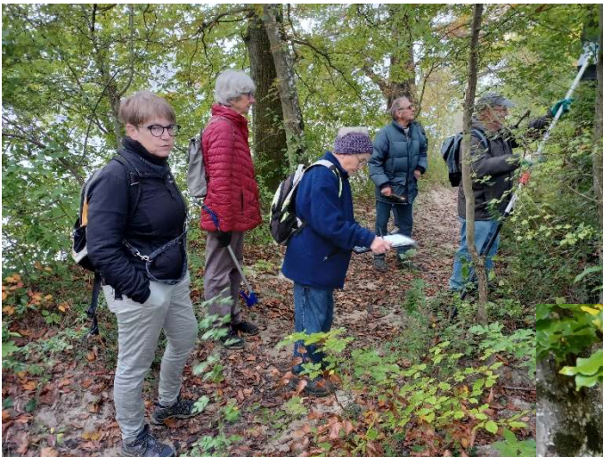
Nistkastenteam 1 in Aktion