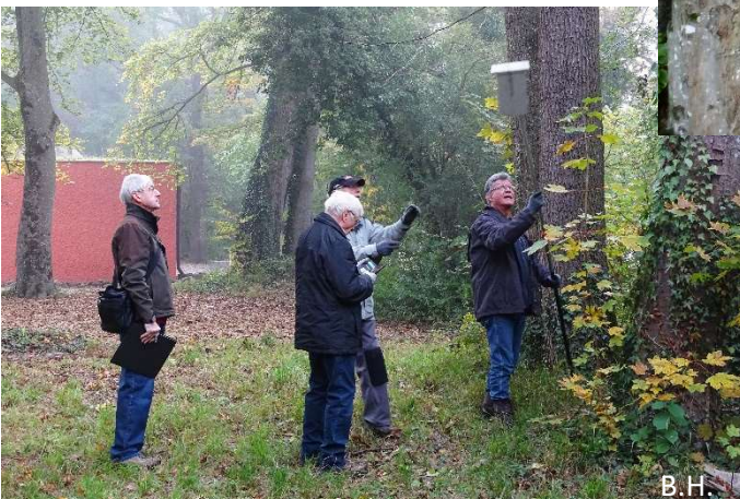
B.H. Nistkastenteam 2 in Aktion