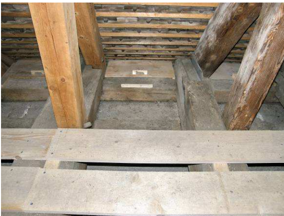
Nistkasten auf der Ostseite

Im September 2009 zügeln wir auf die Westseite. Ursprünglich wollten wir nur die Ostseite machen, doch Andres Beck (Kanton), bewilligte uns das Budget um alles zu sanieren. 700 Arbeitstunden wurden von unserm Verein geleistet.