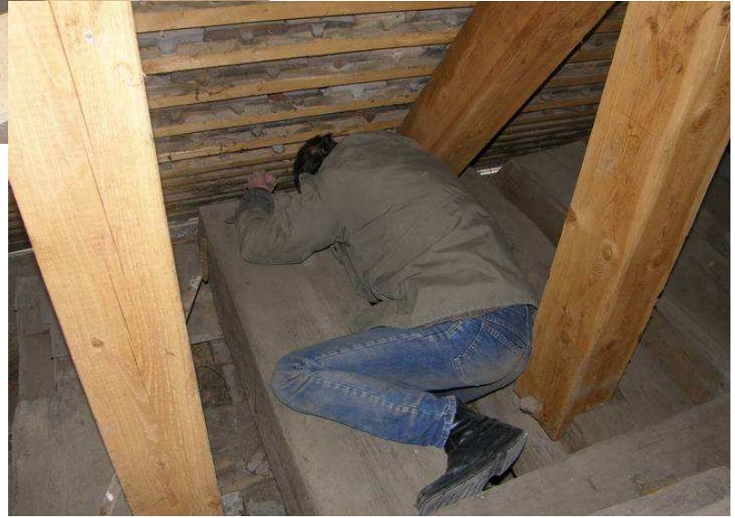
Unbequeme Lage zum Arbeiten.