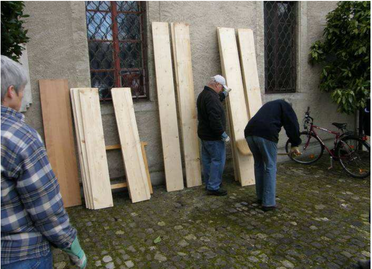
Alles Material muss zuerst 93 Treppenstufen hochgetragen werden. Die grossen Bodenbretter waren 2.50m lang