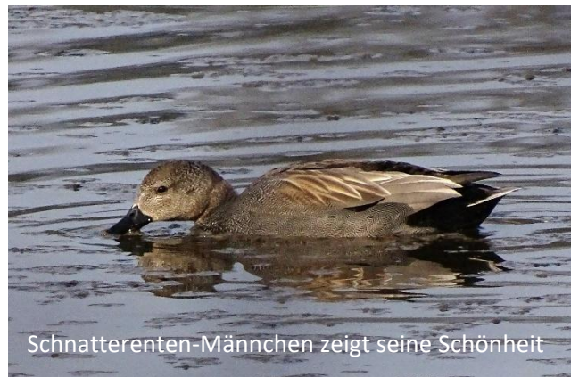
Schnatterenten-Männchen zeigt seine Schönheit