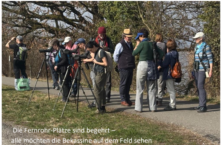
Die Fernrohr-Plätze sind begehrt – alle möchten die Bekassine auf dem Feld sehen

Originalbilder von Beni von der der Exkursion