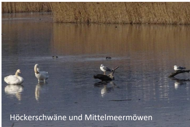
Höckerschwäne und Mittelmeermöwen