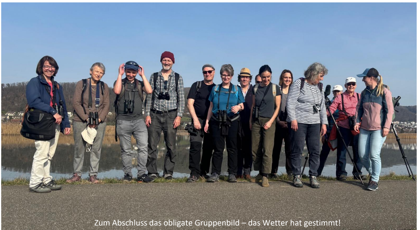
Zum Abschluss das obligate Gruppenbild – das Wetter hat gestimmt!