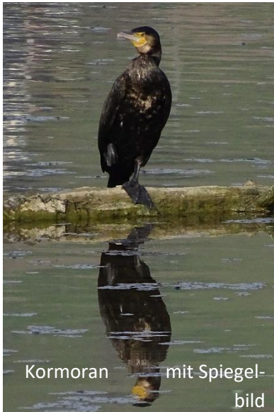
Kormoran mit Spiegel- bild