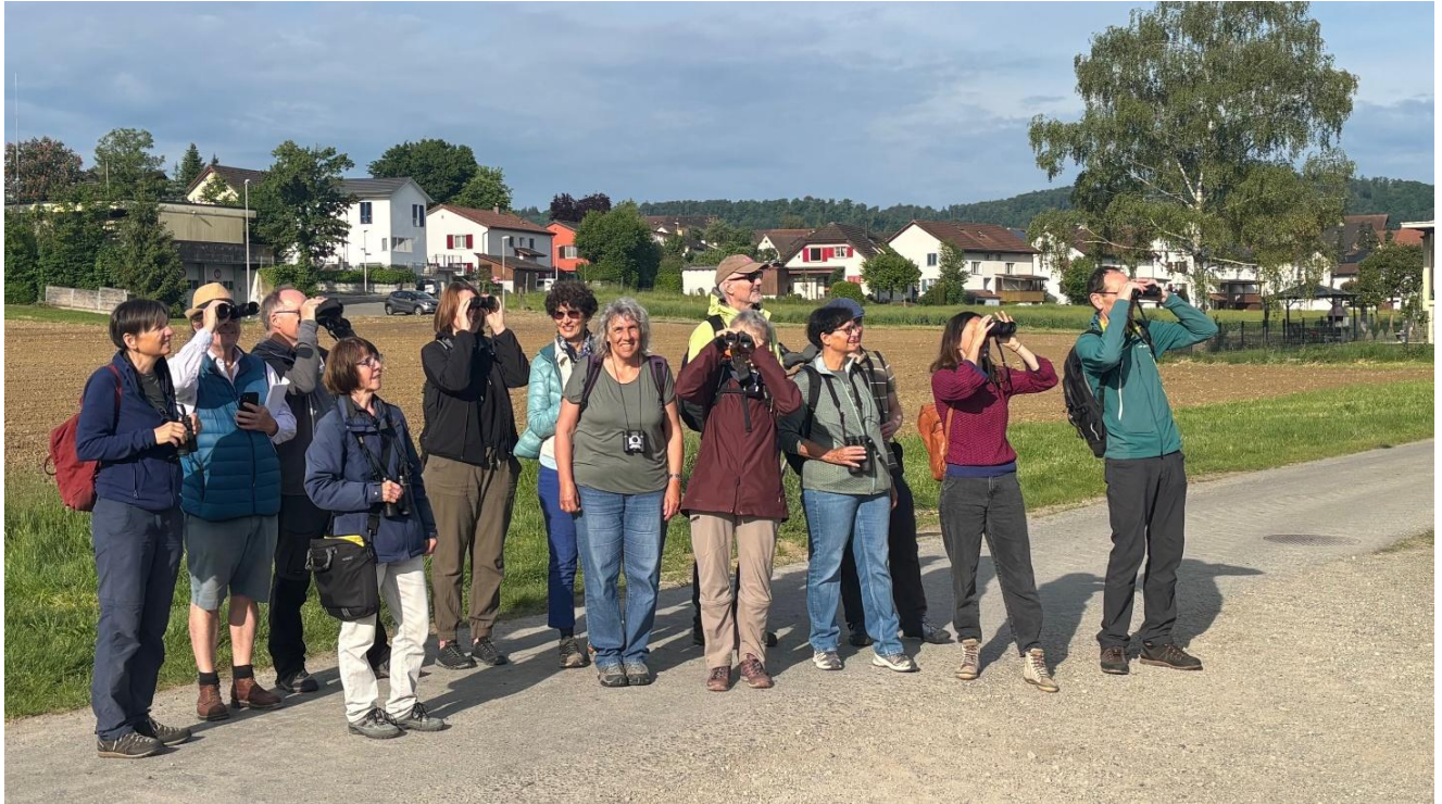
Die Gruppe bei der Schwalben-Beobachtung beim Hof Hauenstein.