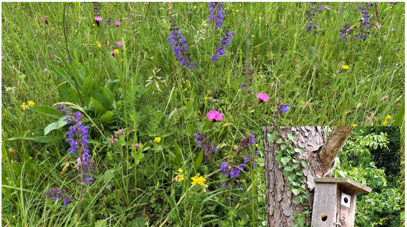
Schöne Blumenwiese mit Wiesensalbei, Kartäusernelke und und ...