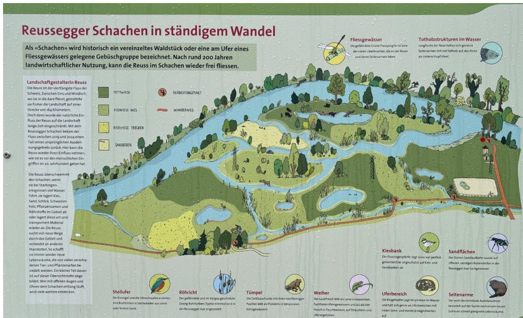
Übersicht des Gebiets aus Informationstafel

Die Geländekammer entlang der Reuss dient als natürlicher Rückhalteraum. Sie wurde in der Vergangenheit bei grösseren Hochwasserereignissen regelmässig geflutet. Der Reussegger Schachen wurde denn auch 2001 im Richtplan als Bestandteil des Auenschutzparks aufgenommen und 2011 in der Richtplanrevision festgesetzt. Ein entscheidender Schritt zur Realisierung des Auenschutzparks im Reussegger Schachen war die Bereitschaft eines Landwirts, sein Land an den Kanton abzutreten, wenn ihm ein anderer Hof angeboten werden könne. Auf Vermittlung von Pro Natura Aargau war dies möglich. Pro Natura Aargau konnte zusätzlich einen Bauernbetrieb erwerben, dessen früherer Eigentümer ebenfalls andern Ortes einen neuen Bauernbetrieb fand.