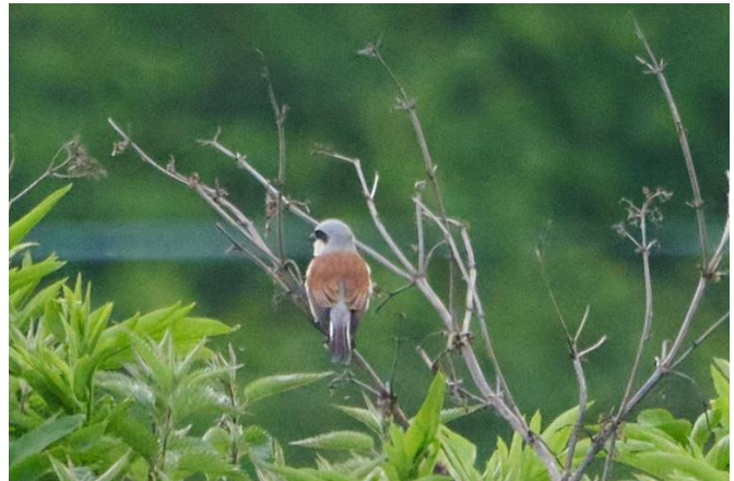
Auch ein schöner Rücken kann entzücken: Neuntöter-Männchen