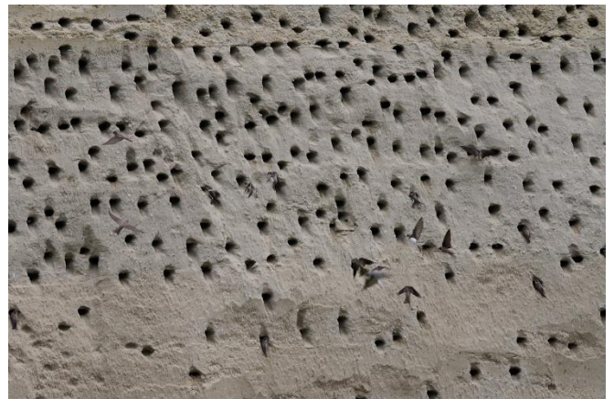
Viel Betrieb bei der Uferschwalben-Brutwand (nächste 4 Bilder)