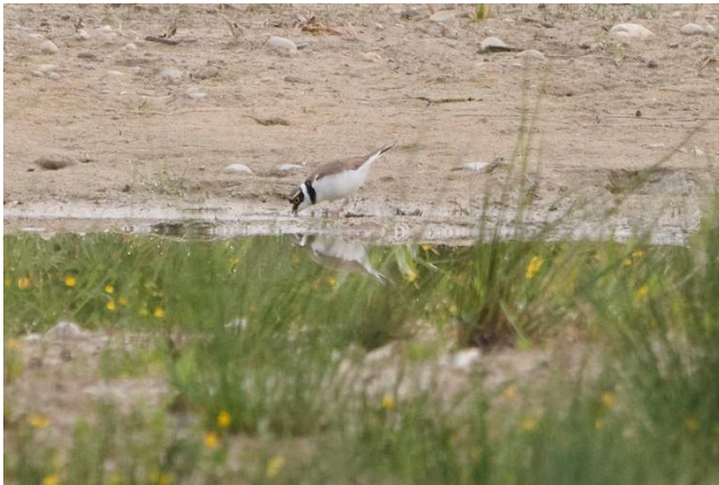
Der Flussregenpfeifer brütet in der Reussegg Aue

Originalbilder der Exkursion von Paul Rudolf (vielen Dank), alle unter https://paulrudolf.jalbum.net/Reussegg/