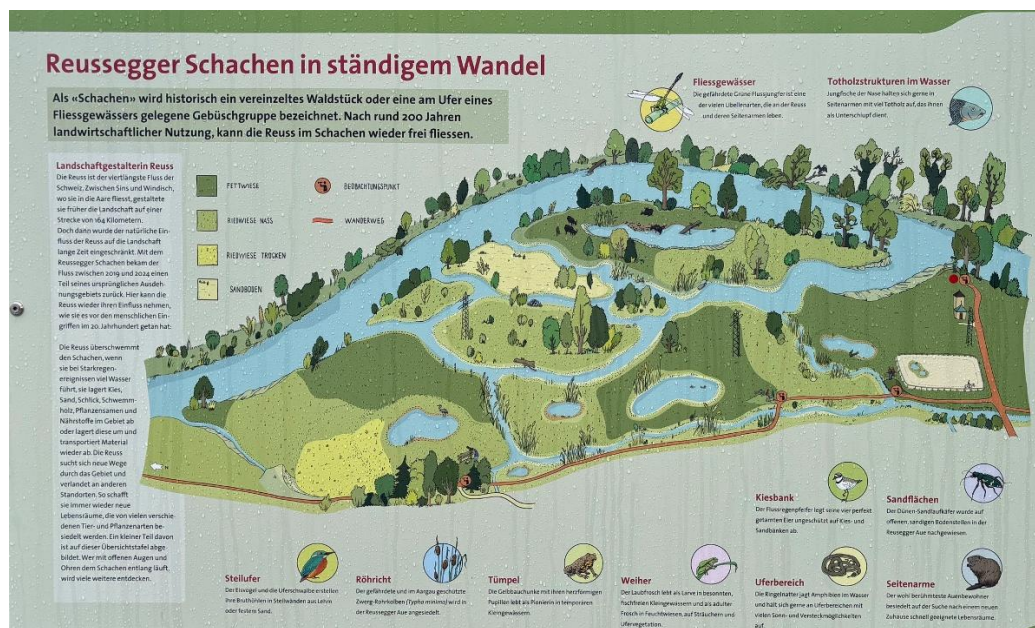
Übersicht des Gebiets aus Informationstafel

Die Geländekammer entlang der Reuss dient als natürlicher Rückhalteraum. Sie wurde in der Vergangenheit bei grösseren Hochwasserereignissen regelmässig geflutet. Der Reussegger Schachen wurde denn auch 2001 im Richtplan als Bestandteil des Auenschutzparks aufgenommen und 2011 in der Richtplanrevision festgesetzt. Ein entscheidender Schritt zur Realisierung des Auenschutzparks im Reussegger Schachen war die Bereitschaft eines Landwirts, sein Land an den Kanton abzutreten, wenn ihm ein anderer Hof angeboten werden könne. Auf Vermittlung von Pro Natura Aargau war dies möglich. Pro Natura Aargau konnte zusätzlich einen Bauernbetrieb erwerben, dessen früherer Eigentümer ebenfalls andern Ortes einen neuen Bauernbetrieb fand.