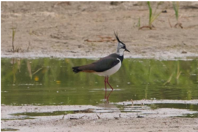
Im vollen Prachtkleid: Kiebitz